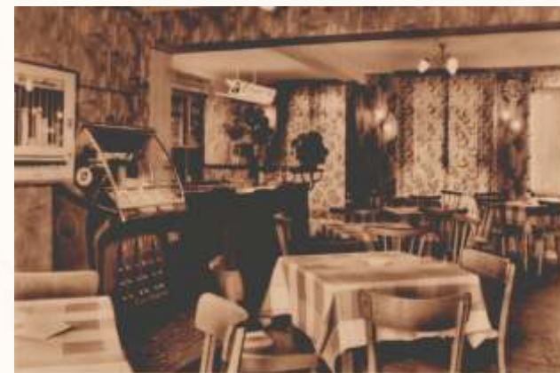
Tradition in vierter Generation — Fotos 60er Jahre Der Lütticher Hof im 21. Jahrhundert: www.luetlicher-hof.de Facebook: www.facebook.com/LuetlicherHof