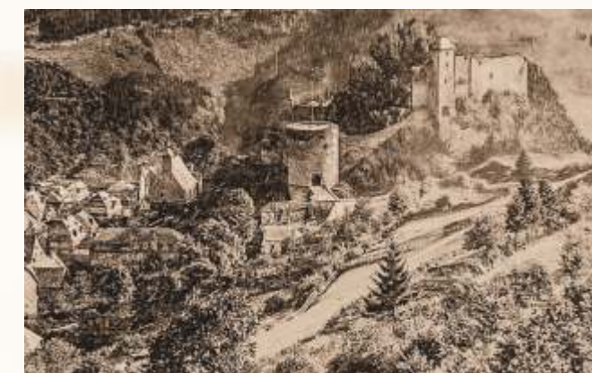
Monschau/Montjoie ca. 1908